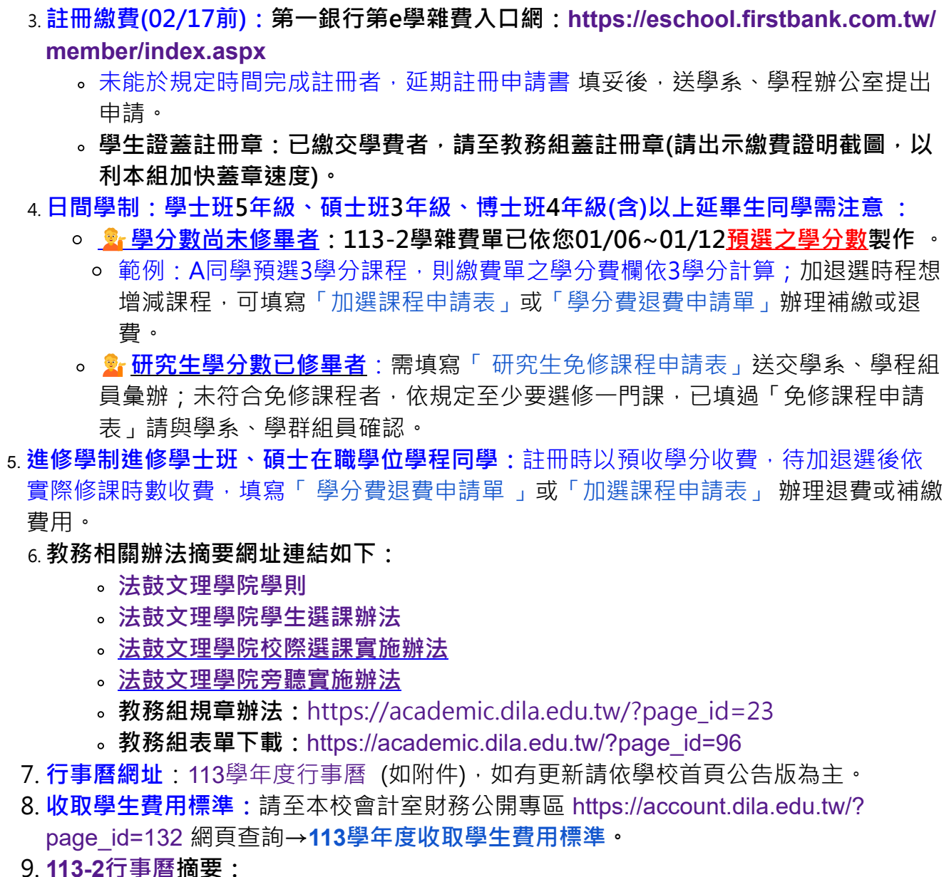
法鼓文理學院 113 學年度【第 2 學期】行事曆

單未列之科目，若自修習，所得成績不予登錄採計。請務必進行「選課確認」，以保障自身權益。